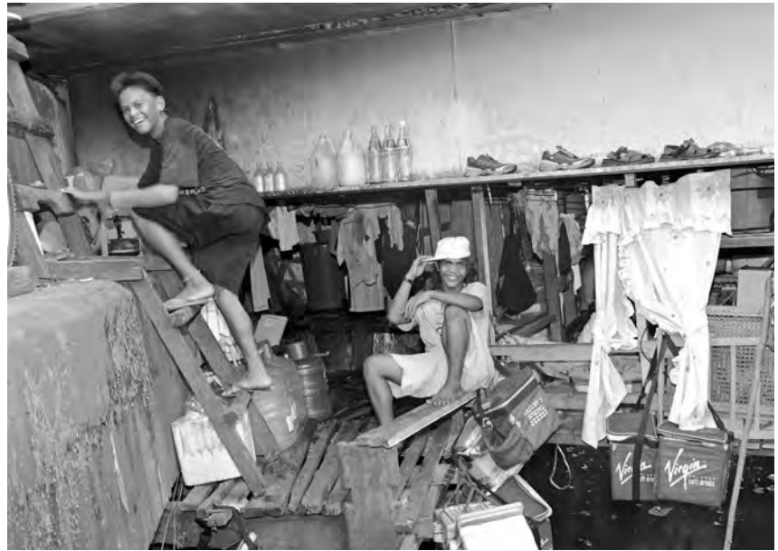
Twee jongeren van 'onder de brug'. Zoals bij veel andere jongeren bestaat hun baan erin om op de snelweg (waar ze onder wonen), gekoelde drankjes te verkopen aan de verkeerslichten (vandaar de koelboxen).

Nog lastiger vinden we het als de toekomst van een wijk, gemeenschap, vele gezinnen op het spel staat. Bijvoorbeeld in de wijk "onder de brug" waar een 80-tal gezinnen onder een expresweg en boven een afvoerkanal wonen. Er is een groots "ontwikkelingsproject" gaande om de rivieren en kanalen in Manilla op te scho-