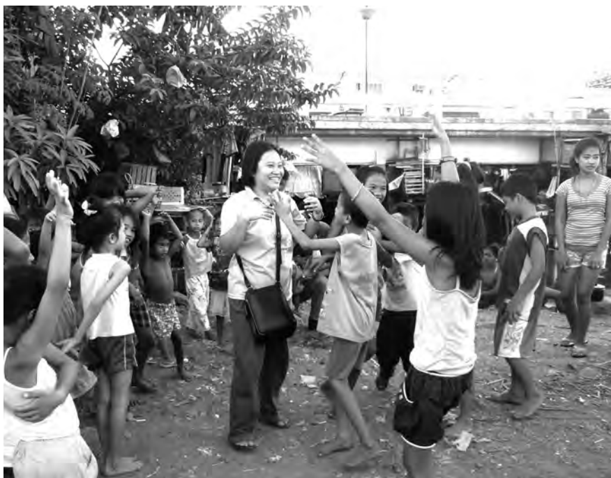
Veel kinderen van "onder de brug" doen mee aan de straatbibliotheek van ATD Vierde Wereld.

Vreemd genoeg verschenen er onmiddellijk de meest gekke foto's en commentaren op Facebook, vaak voorzien van de slogan "It's more fun in the Philippines". Eerst waren we verontwaardigd, maar toen een paar dagen later onze wijk ook begon vol te lopen, konden we met eigen ogen zien hoe de mensen er hier het beste van maken en hun miserie weg lachen. Kinderen gierden het uit in het mega zwembad terwijl we links en rechts mannen rond plastic tafeltjes een biertje zagen drinken alsof er een pool party gaande was.