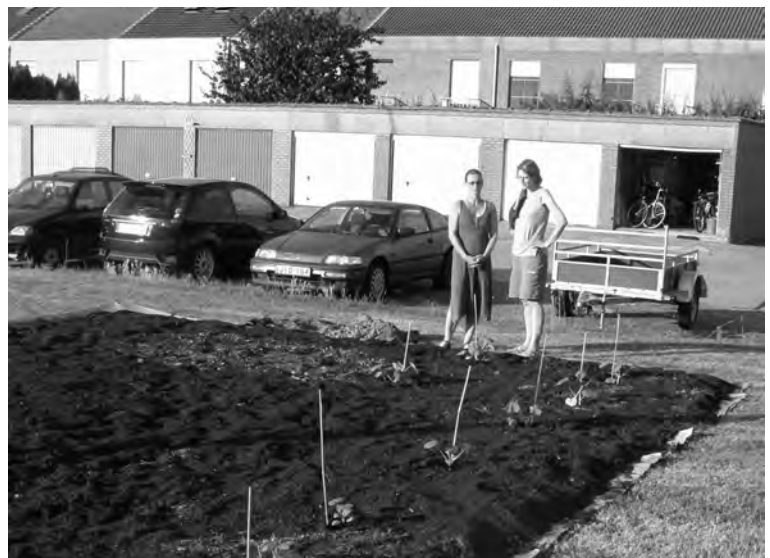
Zaaien en ...

De 'Dongelstuinen' ontstonden vanuit het idee om in een sociale woonwijk twee gras-