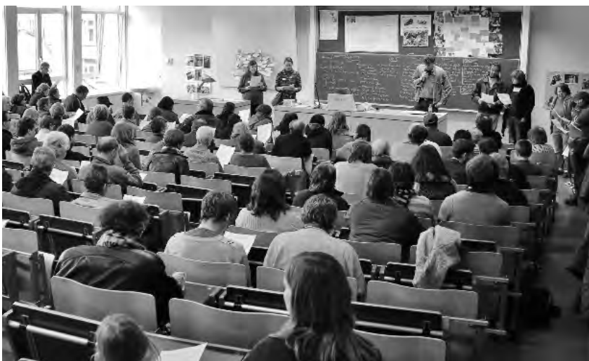
Een tweetalig lied om af te sluiten: 'Er is genoeg voor iedereen - Y'en a assez...'

'Ik werd heen en weer geslingerd tussen moeder en vader en verbleef in instellingen. Ik moest steeds mensen opgeven. Je wordt er hard door. Maar je denkt wel aan die mensen en je mist ze. Ik zit nu in de psychiatrie voor verzorging. Ik ben toch trots op wie ik ben ondanks mijn verleden maar de moed is er niet altijd om door te gaan.'