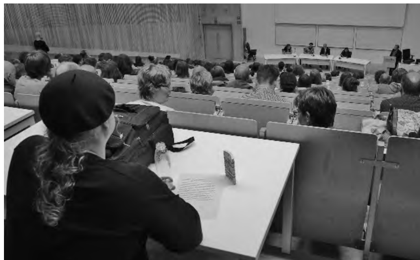
De betrokkenheid van het publiek in de goed gevulde aula van HoGent bij de dialoog na de film is groot.