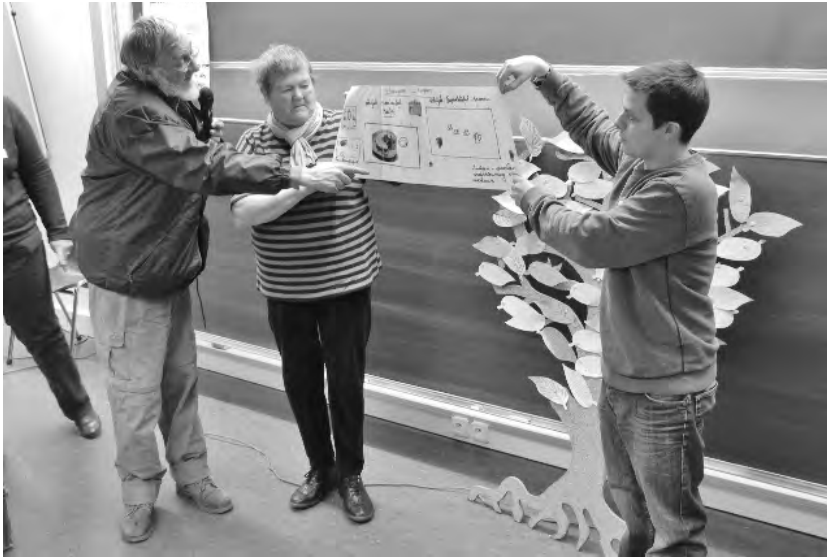
De groep Sint-Andries. 'Ik zie de groep als familie van mij. Ik zie ze meer dan mijn eigen familie.' Op de achtergrond: de boom van fierheid, ook als symbool van familie, heden, verleden en toekomst.

'Bijna iedereen in onze groep had ervaringen met familieconflicten en familiebreuken. We hebben daarbij vastgesteld dat bepaalde mensen worden verstoten door hun familie, ze worden niet aanvaard. Soms grijpen buitenstanders in en gaan families uit elkaar, bijvoorbeeld in het geval van plaatsing van kinderen, of als mensen op straat komen te staan en de vrouw en de kinderen in één opvang en de man in een andere wordt geplaatst. Dat zijn ook allemaal zaken die familiebreuken kunnen veroorzaken.'