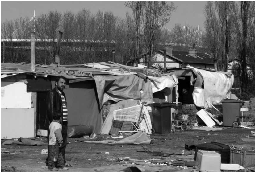
Wie noodgedwongen in een sloppenwijk moet wonen ondergaat continu geweld, al wordt dat niet door iedereen als zodanig (h)erkend.

langer zwijgen en het woord laten aan hen die weten” zo vat een deelnemster uit Peru het colloquium samen. Want er wordt niet alleen gesproken over geweld maar ook over het zoeken naar vrede en het doorbreken van de stilte. Geweld leidt altijd tot stilte van het slachtoffer. Om geweld te doen stoppen, moet de stilte doorbroken worden. Maar, de stilte doorbreken is riskant, je loopt het risico het deksel terug op je neus te krijgen. Als je de stilte doorbreekt, moet je dus zeker zijn dat het geweld niet verder gaat.