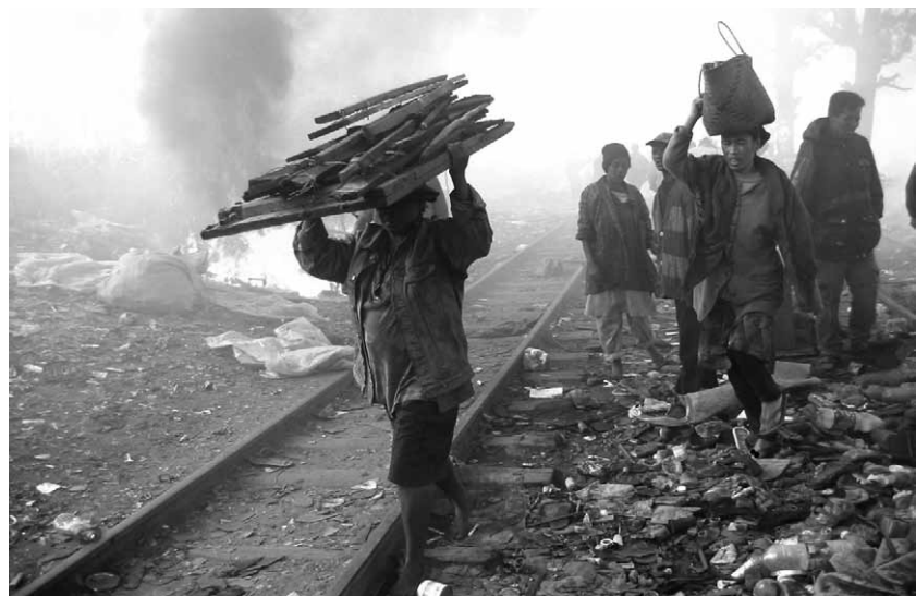
Bewoners van de wijk Lalambay in Antananarivo, de hoofdstad van Madagaskar, werden simpelweg verjaagd toen de autoriteiten na lange tijd besloten een spoorweg opnieuw in gebruik te nemen. (Foto: Fran ois Phliponeau / ATD Vierde Wereld 2003).

Tijdens het colloquium wordt het thema geïllustreerd aan de hand van getuigenissen van deelnemers. "Ze zullen ons nooit zeggen dat we geen mensen zijn, maar ze tonen het ons wel en laten het ons voelen" getuigt een deelnemer uit Groot-Brittannië. Een deelnemer uit Senegal vertelt over de ontruiming van hele dorpen voor de aanleg van een snelweg. Daarna getuigt een deelnemer uit Libanon over geweld dat vaak door de overheid gerechtvaardigd wordt: zo verkiezen de gastarbeiders die in Libanon als huispersoneel werken en vaak het slachtoffer zijn van agressie, om erover te zwijgen en geen klacht in te dienen omdat de aanvallers niet of amper worden aangeklaagd. We kunnen niet langer zwijgen "Wie zwijgt geniet geen gerechtigheid, we kunnen niet