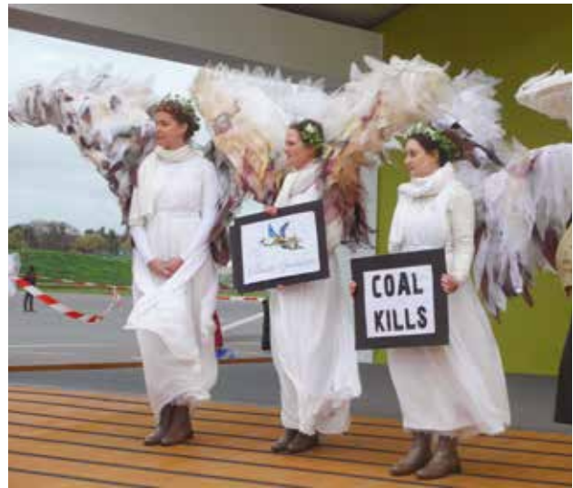
▲ Klimaat-engelen tijdens de top