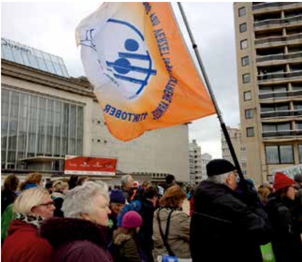
▲ ATD Kust tijdens de klimaatmars.