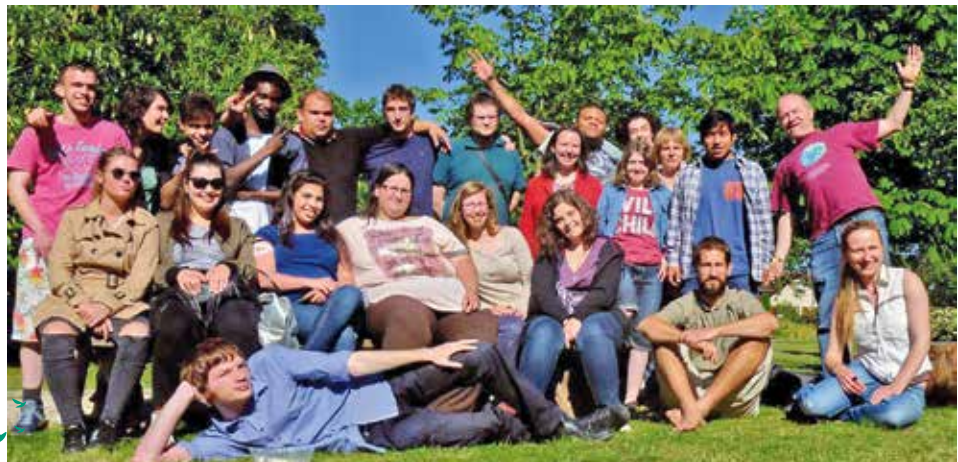
▲ De Franstalige Djynamo-jongeren op weekend