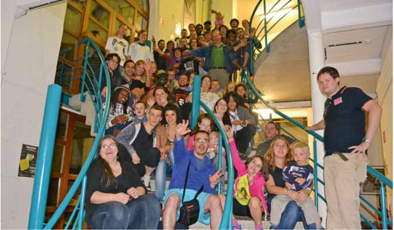
▲ Een traject naar werk moet jongeren keuzevrijheid en onderhandelingsmarge bieden.