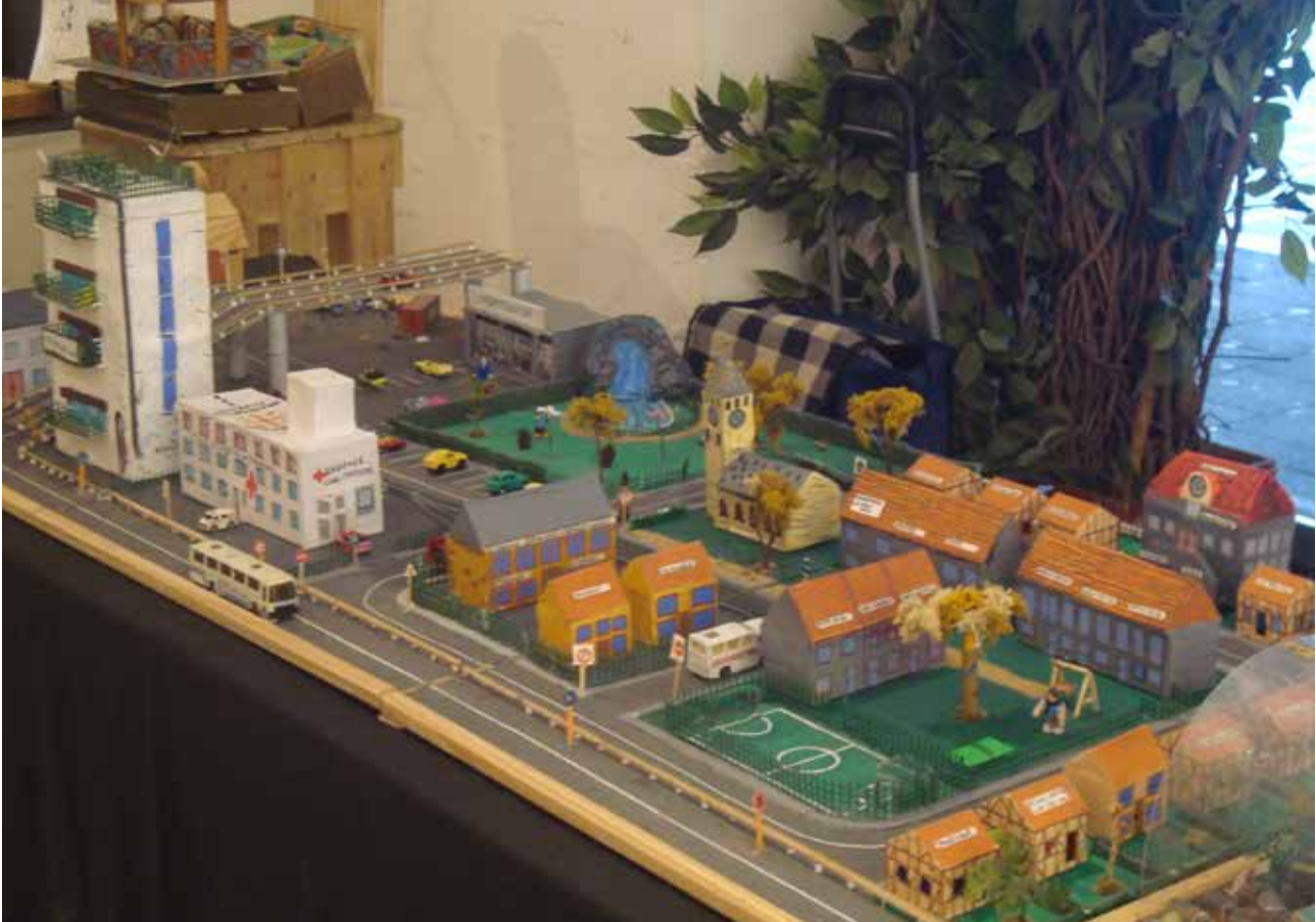
▲ Sommige rechten botsen met elkaar Foto van de tentoonstelling 'Moedige mensen'

zijn dat voor alle uitkeringen dezelfde betaaldag en hetzelfde tijdsinterval geldt. Een relatief stabiel en zeker inkomen op regelmatige tijdstippen helpt mensen echt vooruit.