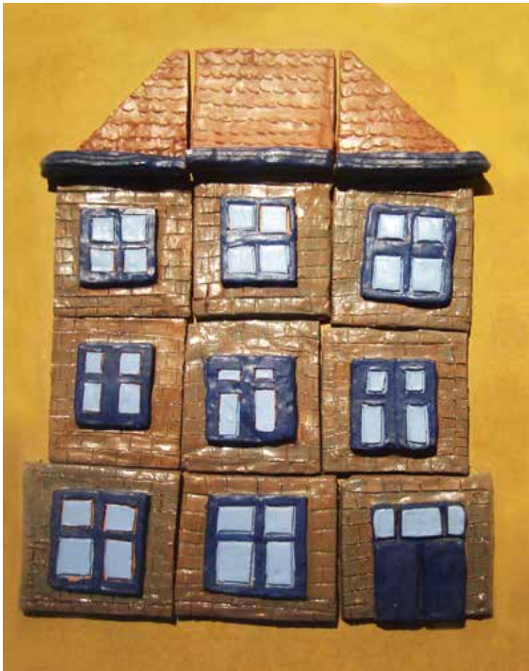
▲ Een woning die op het eerste zicht in orde leek Foto van de tentoonstelling 'Moedige mensen'

Omdat ik dakloos was geweest, kon ik huursubsidies aanvragen. Ik hoorde dat de woning dan wel aan strenge eisen moest voldoen. Ik was bang dat het huis afgekeurd zou worden en dat ik dus geen recht zou hebben op huursubsidies. Bij het OCMW drongen ze aan om deze toch aan te vragen.