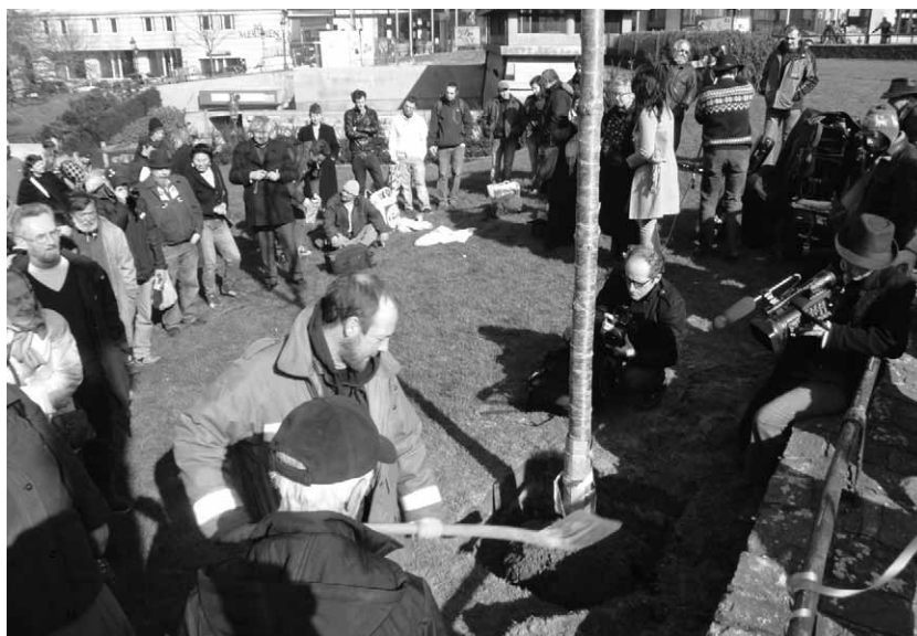
Bij het Centraal Station wordt een Japanse kerselaar geplant voor alle doden van de straat, een levend symbool van hoop.