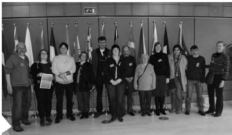
De Europese Volksuniversiteit bracht 120 mensen samen in de Sociaal en Economische Raad : volwassenen en jongeren die een moeilijk leven kennen, medestanders en een 30-tal Europese beleidsmakers. Ze werkten de hele dag samen rond het thema: 'Met Jongeren bouwen aan een Europa zonder armoede en uitsluiting'. Op de foto deelnemers van ATD Vierde Wereld België en Nederland.

* Joseph Wresinski, oprichter van de Beweging ATD Vierde Wereld, antwoordde in 1976 als volgt: 'Daar waar de toekomst van een natie of een internationale gemeenschap wordt voorbereid, is het belangrijk dat de Vierde Wereld meedoet. Als zij er niet bij is als de plannen gemaakt worden, zal ze er ook niet bij zijn als de veranderingen tot stand komen.'