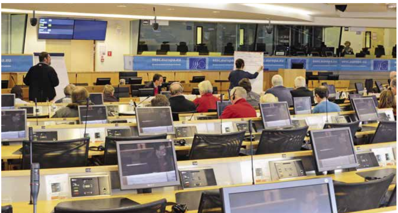
Aan het werk in het Europees Economisch en Sociaal Comité ▲

“MIJN DOCHTER EN IK WERDEN GEZIEN ALS EEN KOPPEL WANT ZE HAD EEN LOON EN LEEFDE MET MIJ ONDER ÉÉN DAK. ZE IS UIT HUIS VERTROKKEN OPDAT IK GEEN GELD ZOU VERLIEZEN, MAAR HET WAS TEGEN ONZE ZIN. MEN ZOU HET INKOMEN VAN MIJN DOCHTER NIET IN REKENING MOGEN BRENGEN; ZE MOET NOG STARTEN IN HET LEVEN.”