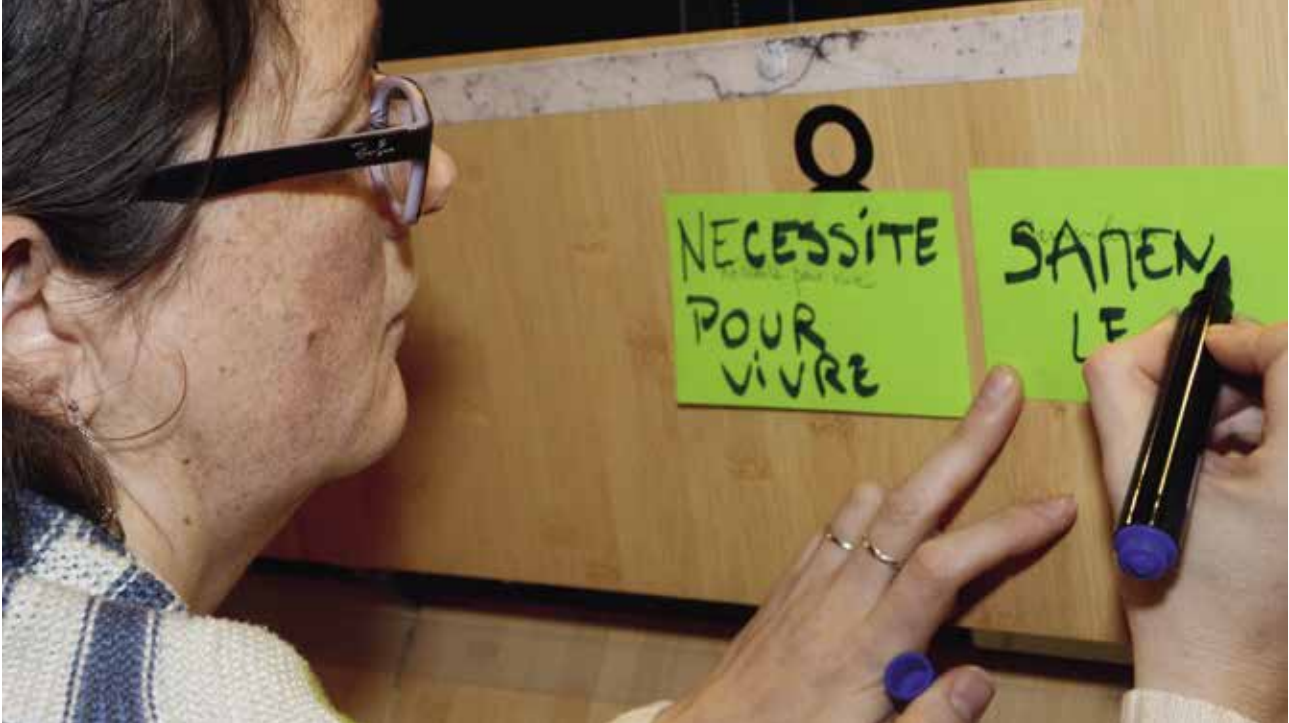
Het recht op bestaansmiddelen is een individueel recht ▲