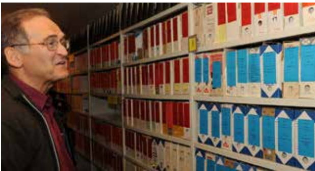
In het archief in Baillet-en-France ▲

De teksten over liefdadigheid zijn vaak verbonden met zijn jeugd. Joseph Wresinski beschrijft hoe hij altijd moest ontvangen en nooit zelf mocht geven. Dit is een relatief onbekend gegeven, maar het is fundamenteel om de beginselen van de beweging beter te begrijpen.