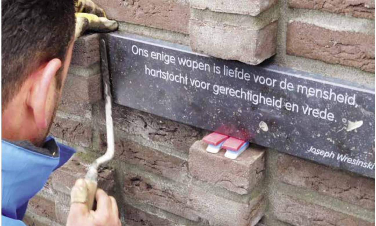
Citaat van Joseph Wresinski op de muur van de Vrede in Nijmegen, ingehuldigd op 11 februari 2017 ▲