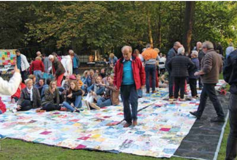
▲ OUDENAARDE: Oudenaarde: De Oudenaaristen maakten een picknickdeken XXXL waar plaats was voor iedereen op 'etinge in't ges'