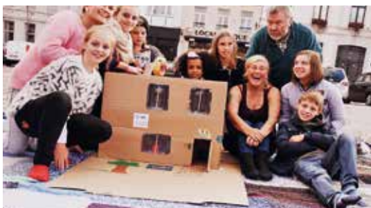
▲ 17 oktober 2016 in Ronse: ATD-leden bouwen hun droomhuis