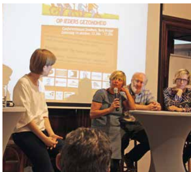
▲ BRUGGE: In de namiddag volgt een panelgesprek in het Stadhuis