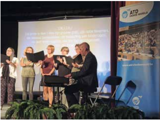
▲ OOSTENDE: 6 koren kwamen samen in Oostende en zongen samen voor waardigheid