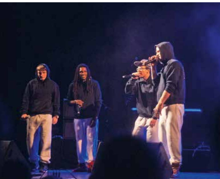
▲ BRUSSEL: Optreden door de jongeren van Betonne Jeugd