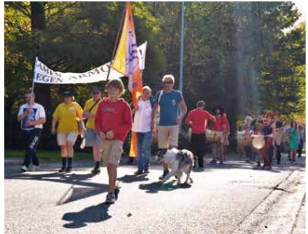
▲ WILLEBROEK: Wandeling langs verschillende lokale organisaties op 'Wel(le)zijn Willebroek'