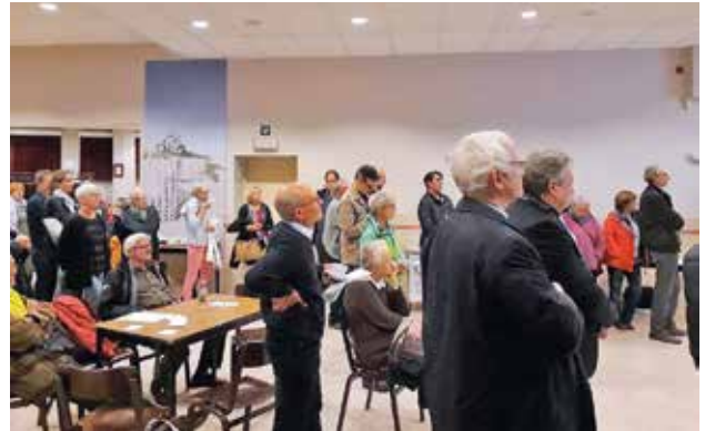
▲ HASSELT: wake en getuigenissen in het Volkstehuis