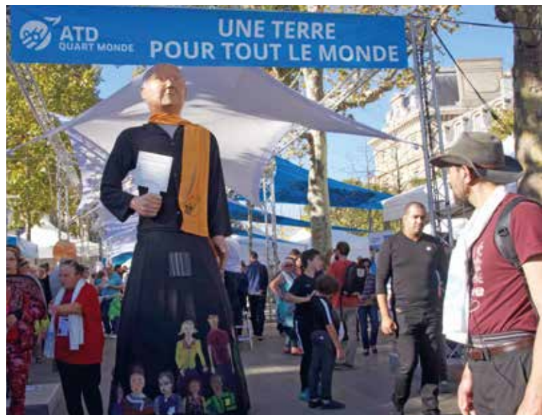
▲ PARIJS: 30.000 mensen verzamelden in Parijs waaronder een delegatie vanuit België