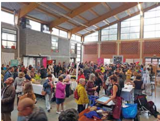
▲ BRUSSEL: 'Verzet uit onverwachte hoek?!': standen en workshops door alle partnerorganisaties