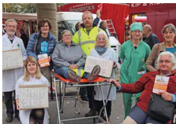
▲ BRUGGE: De groep van Brugge spreekt marktbezoekers aan over het recht op gezondheid