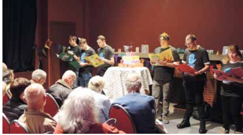
De jongeren van Djynamo Vlaanderen ▲