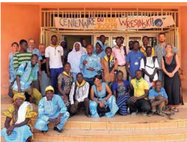
▲ OUAGADOUGOU, BURKINA FASO: De festiviteiten rond 17 oktober duurden 3 dagen lang in Burkina Faso met onder meer een filmvertoning, debatten en optredens