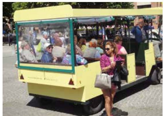
▲ Welkom in Brugge. Juni 2015. Brugse medestanders ontvangen bezoek uit Ronse.

Iedereen wil wel eens een bezoek brengen aan Brugge. Met onze medestandersgroep organiseren we af en toe een dagje Brugge voor een groep van ATD Vierde Wereld of voor een andere vereniging waar armen het woord nemen. Ook groepen uit Wallonië en Frankrijk waren al te gast. De medestandersgroep bestaat meer dan 30 jaar en ontstond toen we met enkele Bruggelingen ATD Vierde Wereld leerden kennen. Met de verworven inzichten keken we naar de stad en zagen meer dan voorheen de struikelstenen waar gezinnen in armoede over vallen. We ontdekten veel meer armoede dan we voor mogelijk hadden gehouden. We bleven samenkomen en zochten andere medestanders. We verdiepten ons in de huisvestingsmarkt, gingen in gesprek met alle mogelijke instanties en deelden onze bevindingen op informatiemomenten.