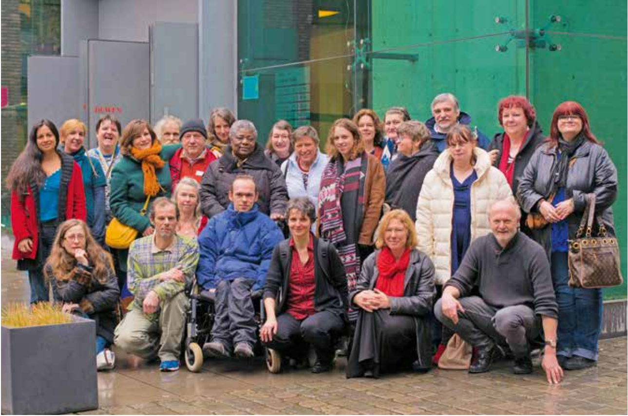
▲ Een krachtige groep.

Bind-Kracht groeide uit tot een samenwerkingsverband van onderzoekers, trainers en coaches, die samen kennis ontwikkelen over kwaliteitsvolle hulpverlening aan mensen in armoede en dit vertalen in vormingsprogramma's voor professionele hulpverleners en vrijwilligers.