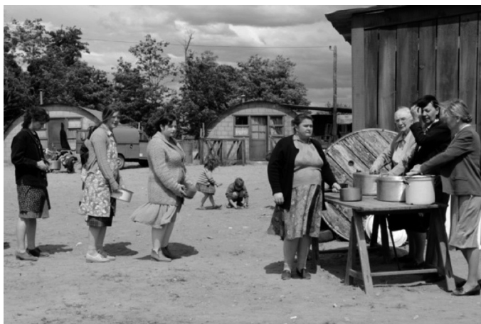
De erbarmelijke toestanden in het kamp in Noisy-le-Grand zijn rauw-realistisch verfilmd.

de bekende acteur Jacques Weber, in zijn strijd met de autoriteiten, maar ook met de gezinnen, die hem in eerste instantie als een bedreiging zien. “Die verdomde pastoor maakt het nog erger, straks staat de politie hier. (...) Als hij ons blijft opruien zal er controle komen.” Maar Joseph weet de meeste bewoners van het kamp en