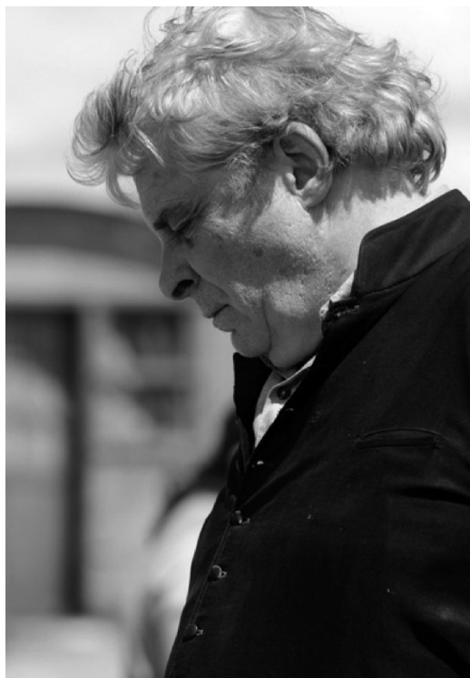
Jacques Weber speelt Joseph Wresinski

De film ontleent zijn kracht ook aan de onwaarschijnlijke samenwerking tussen professionele acteurs en gelegenheidsspelers, ook jongeren en kinderen, die zelf in hun leven armoede hebben meegemaakt. Dit maakt de film nog realistischer, omdat de inbreng van deze mensen werd gebruikt om de dialogen en scènes te versterken.