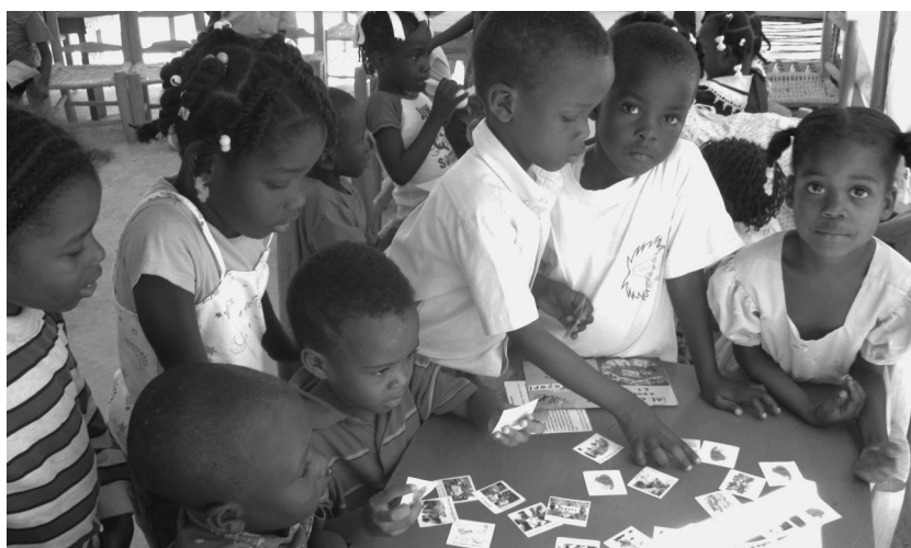
Kinderen in Port-au-Prince die meedoen aan een groep van ATD Vierde Wereld om zich voor te bereiden op echt naar school gaan. Ze spelen Memory met een spel dat door andere kinderen uit Latijns-Amerika is gemaakt. (Foto: Christine G routet, ATD Vierde Wereld).

Tekst van Benoît Fabiani - vertaald en bewerkt door Ton Redegeld en verschenen als 'Vierde Wereld Verkenningen 18' Samenvatting: M.T. Poppe