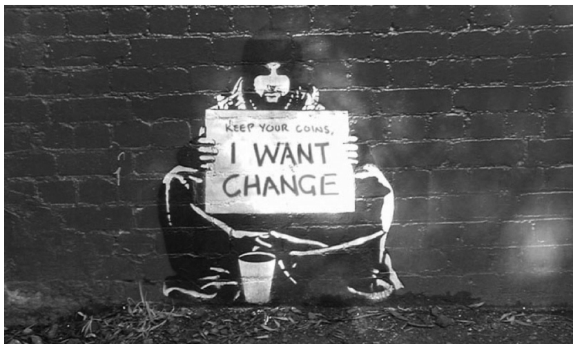
Graffiti van 'Banksy', een anonieme Engelse kunstenaar.

In het basisonderwijs zien we al een achterstand ontstaan. Echte schoolmoedigheid treedt meestal later op. Veel kinderen gaan naar het beroepsonderwijs, terwijl ze meer intellectuele capaciteiten hebben. Op 12 jaar moeten ze al een beroepskeuze maken, begrijpelijk dat er veel verkeerde keuzes gemaakt worden. Als ze niet slagen in het dagonderwijs gaan ze naar het deeltijds onderwijs, met het gevoel: dit is een noodoplossing. Jongeren kunnen geen bewuste keuze maken. Ik heb zelf een diploma van maatschappelijk werk maar ik vond het in de werkgroep behoorlijk ingewikkeld toen al die verschillende vormen van onderwijs en systemen van deeltijds onderwijs aan bod kwamen. Jongeren hebben die kennis niet. Ze stappen in iets dat al uitgewerkt is, dat niet vertrekt vanuit hun behoeften, begrijpen niet altijd wat van hen gevraagd wordt en waarom. Ze hebben veel meer individuele begeleiding nodig. Wij kunnen daar gedeeltelijk voor zorgen. Wij kunnen hen begeleiden naar een