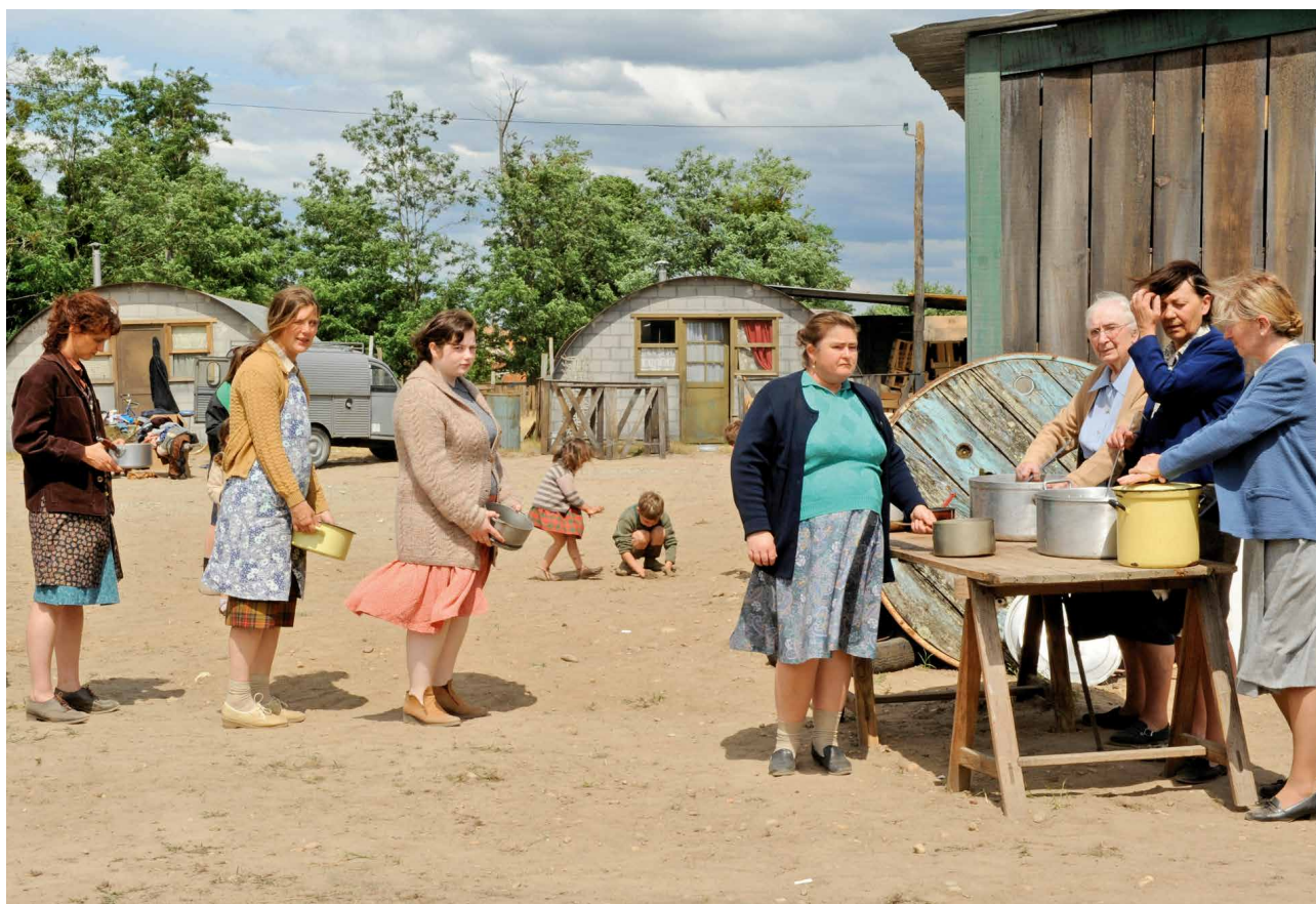
▲ De film 'Joseph de rebel' gaat over het ontstaan van ATD Vierde Wereld