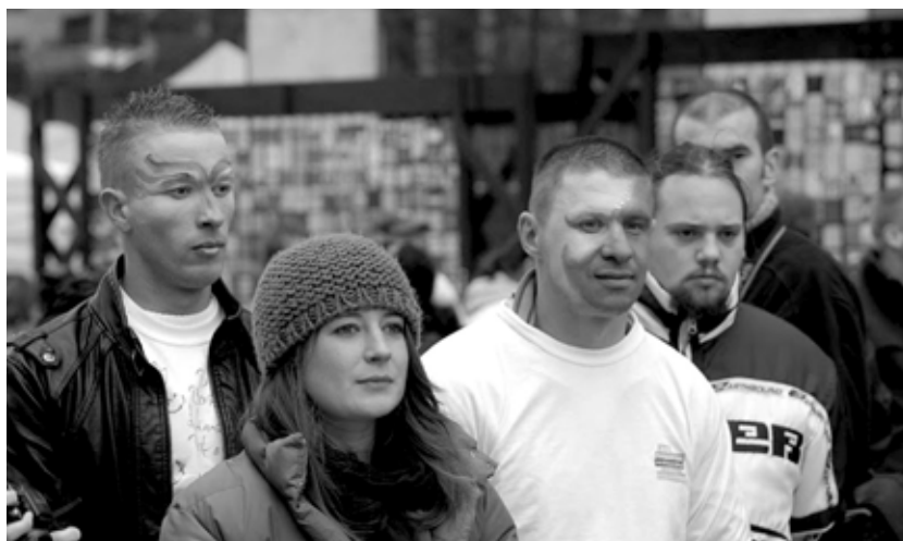
Samen bouwen aan een draagvlak voor een waardige armoedebestrijding.

Waar ligt u wakker van? Een vraag gesteld op een Volksuniversiteit van de Vierde Wereld. Het antwoord bestond uit een foto. Een haag van wachtende mensen, met boodschappentassen. Wachtend op voedsel. Zo toont zich armoede in Europa. Waarom is dit beeld zo angstaanjagend? Om de vernedering die het uitdrukt, omdat aanschuiven voor voedsel vrijheid ontnemt en afhankelijk maakt. Daar sta je dan, wachtend, niet in staat om naar de toekomst te kijken. Wat morgen? Volgende week? Volgend jaar? En meer van hetzelfde voor onze kinderen later?