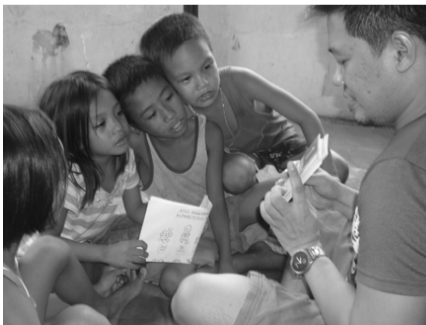
De straatbibliotheken : lees- en leerplezier voor kinderen en vrijwilligers

De zorg om niemand achter te laten en de wil om de ervaring van wie het moeilijkst meekan, volop te benutten tijdens de ontwikkeling van hulpprogramma's en activiteiten, zijn ook voor ons het kompas dat we regelmatig op de vergadertafel willen zetten. Neem nu de straatbibliotheken. Ze hebben jarenlang ontzettend veel lees- en leerplezier gebracht voor grote groepen kinderen en vrijwil-