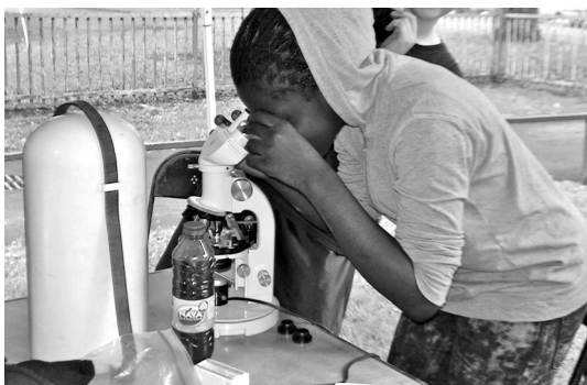
Festival van gedeelde kennis in Montreal, juni 2011.