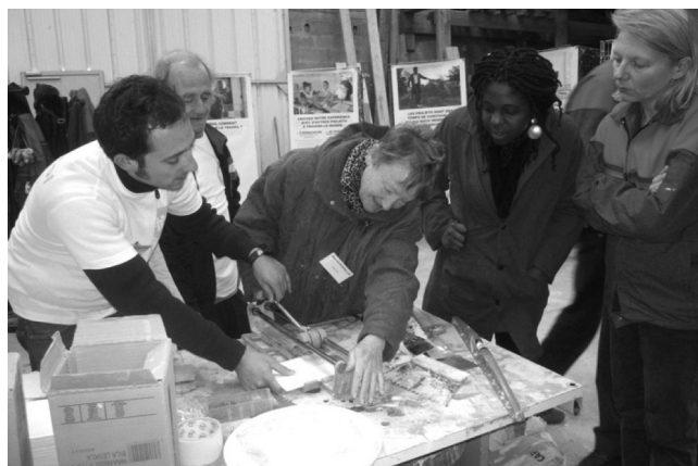
Tijdens een open dag tonen medewerkers hun vaardigheden.

zijn echter in de eerste plaats medewerknemers. Ze voeren dezelfde taken uit en dragen dezelfde werkkledij. Ze ontvangen hetzelfde salaris en engageren zich om minstens één jaar mee te werken. Een ingenieur informatica gaat niet direct naar de IT-ploeg maar eerst naar de gebouwenploeg, om te vermijden dat hij of zij ongewild en automatisch de rol van ploegleider op zich neemt. Makkelijk is het niet. Er is hoe dan ook een kloof. Een compagnon getuigt hoe moeilijk ze het aanvankelijk had met het soms trage werkritme, met de afwezigheden, met alcoholproblemen bij collega's. Pas na lange gesprekken met een collega die armoede kende kon ze inzien hoe een contract bij TAE voor de meesten een heel groot verschil maakte