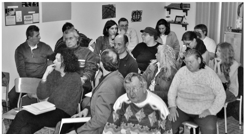
Volksuniversiteit van januari 2010 in Montreal. Thema: Vervoer, een belangrijke behoefte.