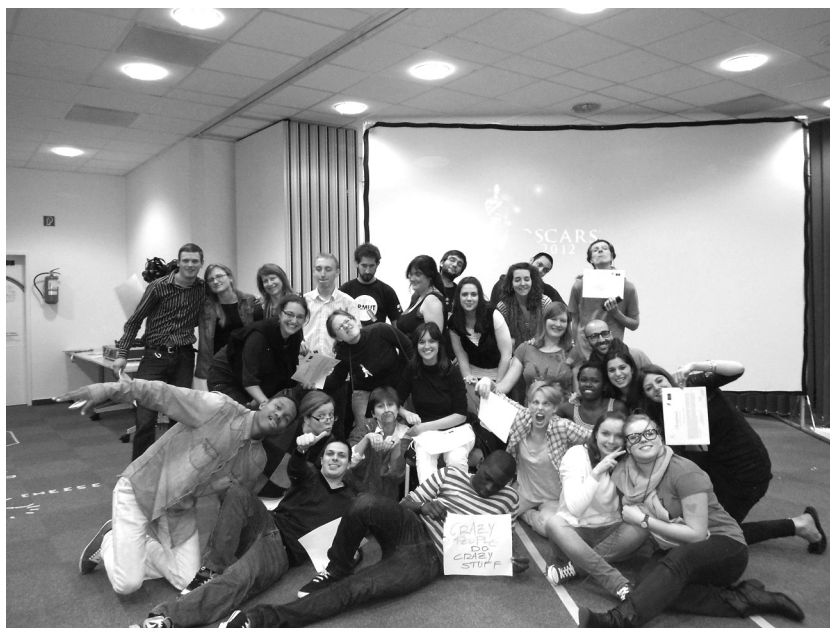
Een bont gezelschap van 28 deelnemers uit zeven verschillende Europese landen (België, Frankrijk, Spanje, Groot-Brittannië, Polen, Italië en Duitsland) deed mee.

Een aanvang maken met het schrijven van aanbevelingen voor drie doelgroepen stond 's middags centraal : jeugdverenigingen, lokale overheden