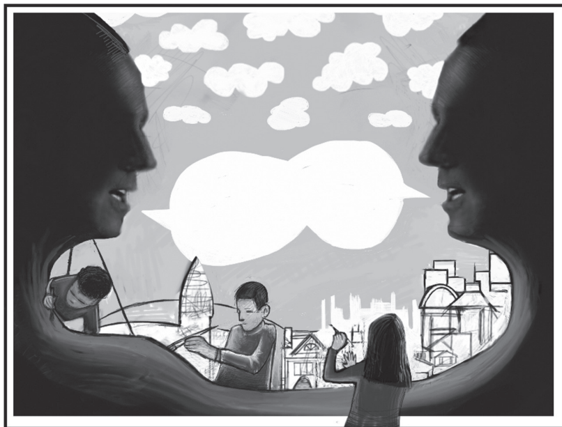
Tekening : Steven Gryspeerd

Creatief zijn of kunst maken is in dialoog treden met jezelf, je diepere, onbekende kanten opzoeken en deze