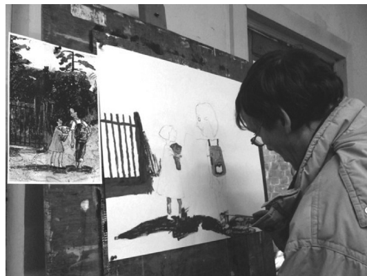
Momenten van magische stilte.