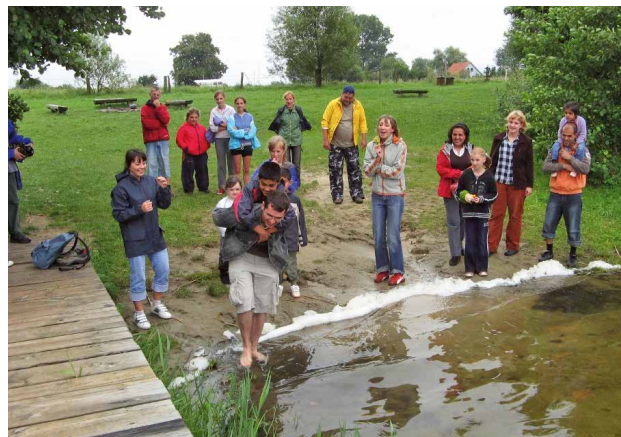
▲ Duitse vrijwilligers en vluchtelingenfamilies samen op verlof in Brandenburg in 2007. Mooie gedeelde herinneringen.

klassen. De lievelingsvluchtelingen zijn opgeleide Syriërs en mensen uit landen met terreur en oorlog. De zogenaamde economische vluchtelingen zijn in Duitsland niet geliefd. En daartoe rekent men vooral de mensen uit Oost-Europa en de Balkan. Dat ze met hun kinderen in krotten woonden, zonder toegang tot werk en scholing, wordt niet gezien. Onderaan de populariteitsschaal staan dan de Roma.