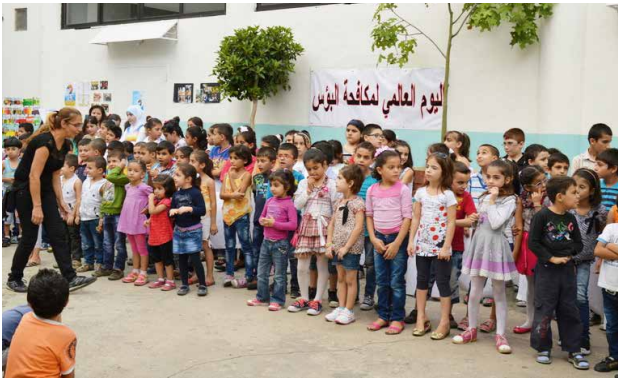
▲ Ook bij Beitouna doet iedereen mee aan de Werelddag van Verzet tegen Extreme Armoede

www.overcomingpoverty.org of www.refuserlamisere.org