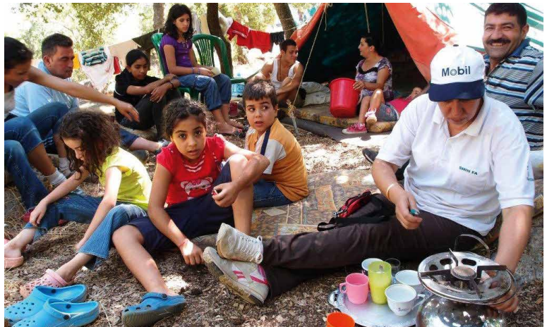
▲ Syrische vluchtelingen vinden een nieuwe thuis bij Beitouna

Libanon is een klein en dicht bevolkt land aan de Middellandse Zee. In het zuiden grenst het aan Israël, maar het langst is de grenslijn met Syrië, in het noorden en het oosten. Het land telt 4,5 miljoen inwoners. Daarbovenop zijn er meer dan één miljoen vluchtelingen.