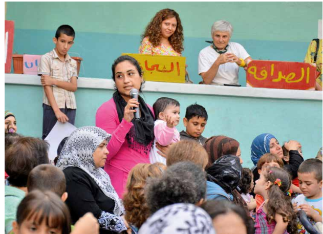
▲ In het buurthuis vinden mensen een luisterend oor

“Een persoonlijke vriendschapsrelatie, geloven in ieders waardigheid en ons hart openen, dat is het belangrijkste. Of we Libanees zijn of vreemdeling, we hebben dezelfde behoefte aan solidariteit. Als we de vluchtelingen moed geven zien we dat hen dat raakt en dat ze zich veilig voelen. We doen ook inspanningen om bedelende kinderen te benaderen en om iedereen die aan onze deur staat een antwoord te geven. We zouden de middelen willen om nog meer te doen, want velen raken niet tot bij ons en hebben nog een veel moeilijker leven.”