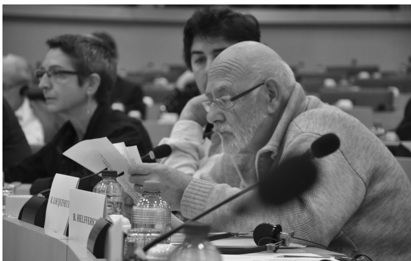
15 oktober 2014 – Openbare vergadering in het Europees Parlement

‘Het maatschappelijk middenveld bestaat niet alleen uit werkgevers en vakbonden. Het is breder. Het is ook jullie beweging (...). Het is die ruimte, die dialoog, die jullie moeten opeisen. Die dialoog die jullie hier in de Volksuniversiteiten voeren moet ruimte krijgen in het middenveld. Het is een boodschap van onderuit. Van alle kanten moeten we stimuleren om die dialogen aan de gang te houden.’