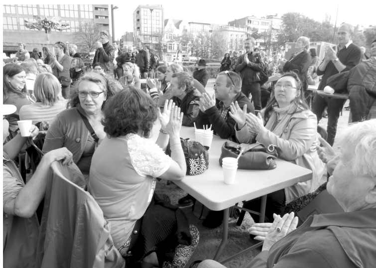
Oostende, 17 oktober 2014 - Velen gaven gehoor aan de oproep om hun verzet tegen armoede en uitsluiting te uiten.

De stem van mensen in armoede vindt maar een zwakke weerklank in de politieke besluitvorming. Gelijkaardige situaties zijn in het ene geval fraude en in het andere geval volkomen wet-