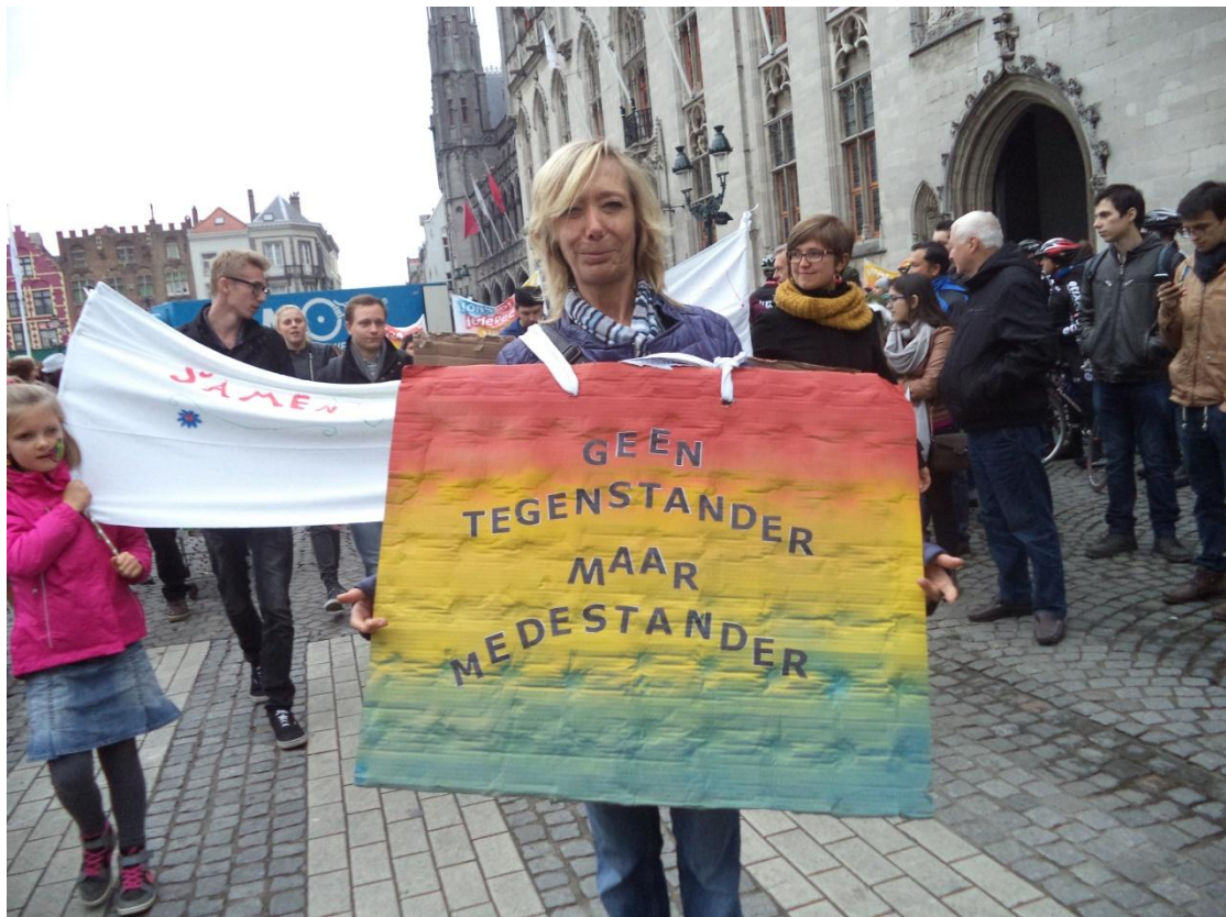
Beeld uit de optocht door Brugge op 17/10/2015 (Werelddag van Verzet tegen Extreme Armoede)

Dit voortgangsrapport werd goedgekeurd op de Algemene Vergadering van ATD Vierde Wereld Vlaanderen op woensdag 20 april 2016.