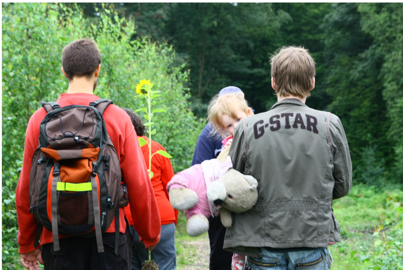
Crédit photos : dos et couverture © ATD Quart Monde – séjour « jeunes et jeunes familles créateurs de solidarité » Remersdaal - 2011

Asbl ATD Quart Monde Jeunesse Wallonie-Bruxelles 12, avenue Victor Jacobs – 1040 Bruxelles Tél : 02/640 04 93 Fax : 02/640 73 84 Mail : jeunesse.tapori@quartmonde.be Site internet : www.atd-quartmonde.be